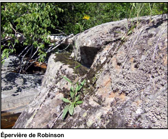
Épervière de Robinson